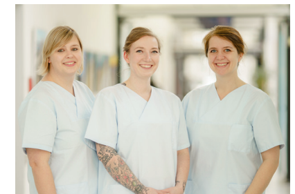
DEIN TEAM DEINE AUSBILDUNG