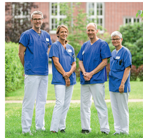
DIE FREIGESTELLTEN PRAXISANLEITERINNEN UND -ANLEITER (LINKS KJK, RECHTS AK) SIND DEINE FESTEN BEZUGSPERSONEN.

Wir lieben unseren Beruf – und bilden von Herzen aus.